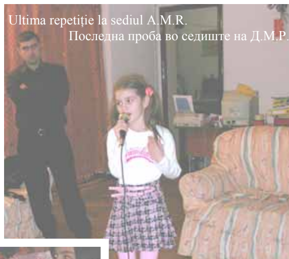
Последна проба во седиште на Д.М.Р.