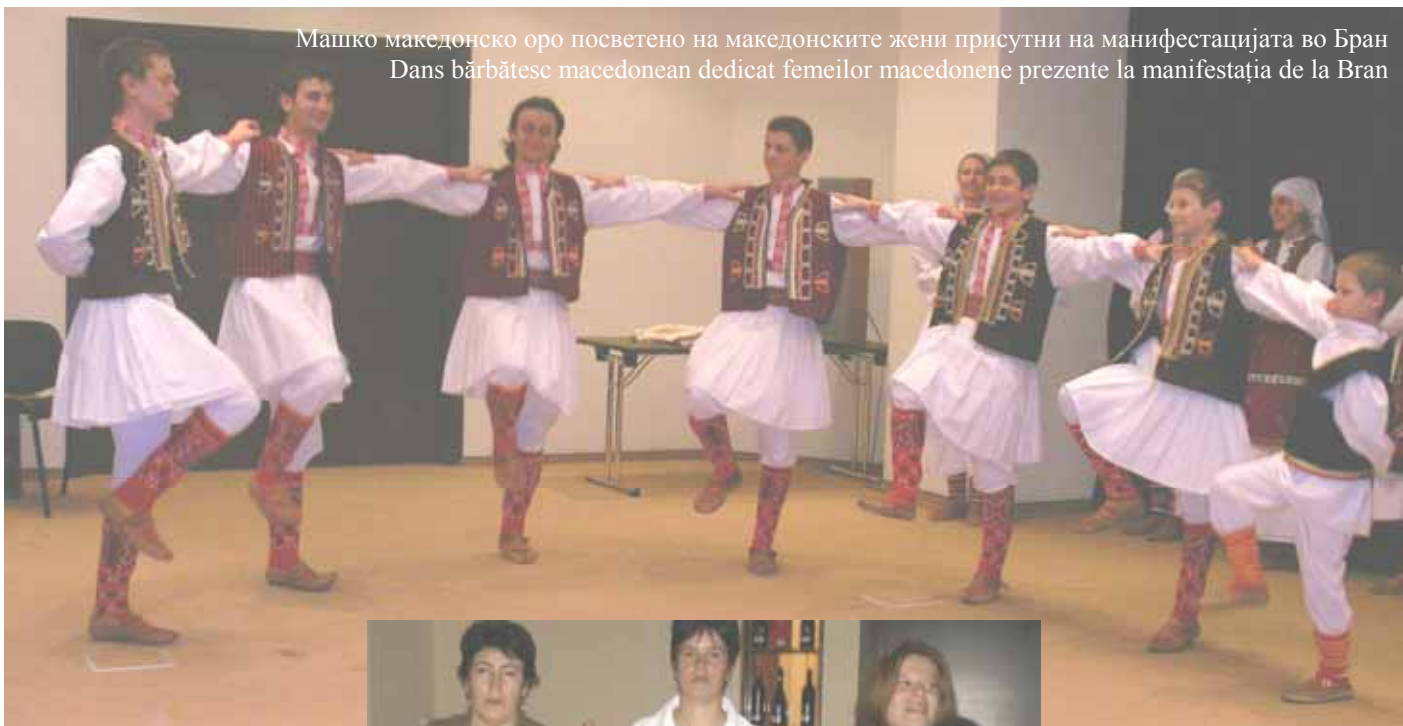
Машко македонско оро посветено на македонските жени присутни на манифестацијата во Бран Dans bărbătesc macedonean dedicat femeilor macedonene prezente la manifestația de la Bran

Думитреску, организира во Бран традиционална манифестација за жените македонки со наслов: "Секоја жена едно цвеќе". Дојдени од сите краеве на земјава, македонки од Тимишоара, Јаши, Баилешти, Урзикуца, Крајова, Подари и Букурешти се радуваа