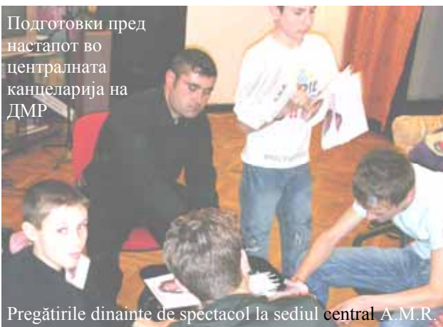
Pregătirile dinaintea de spectacol la sediul central A.M.R.