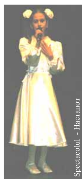
Спектациул - Настапот