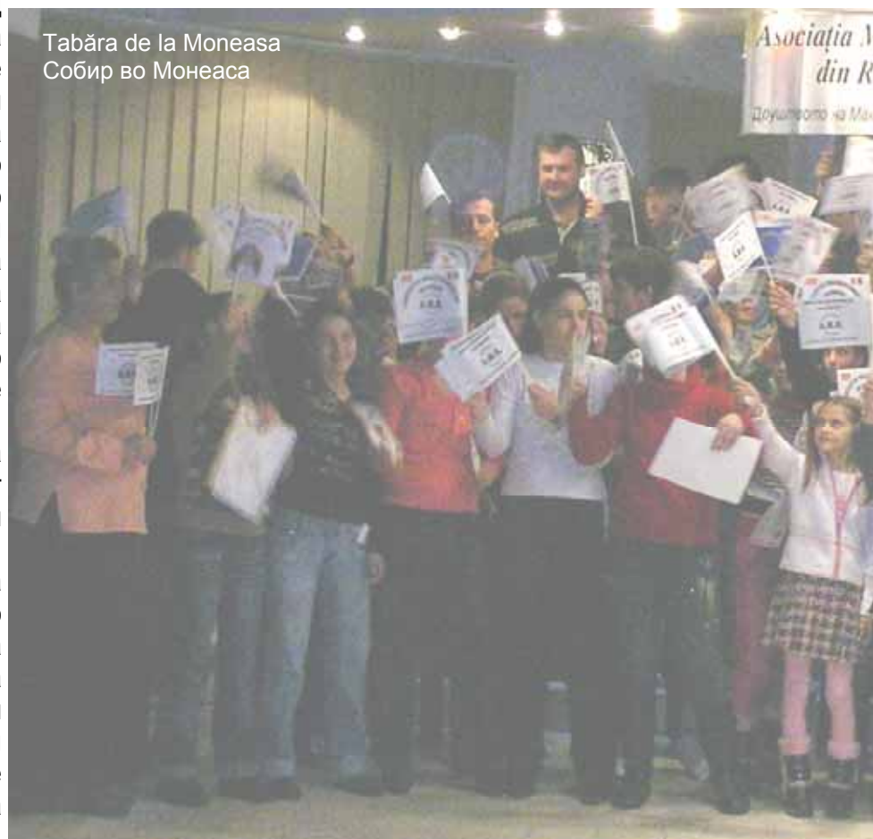
Tabăra de la Moneasa Собир во Монеаса